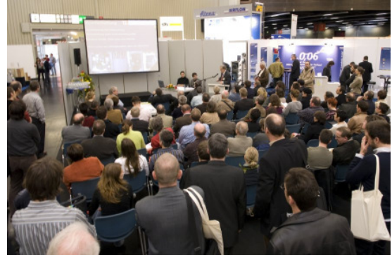
Passivhaus-Ausstellung 2010, und Hersteller-Forum (Dresden), Foto:Passivhaus Institut